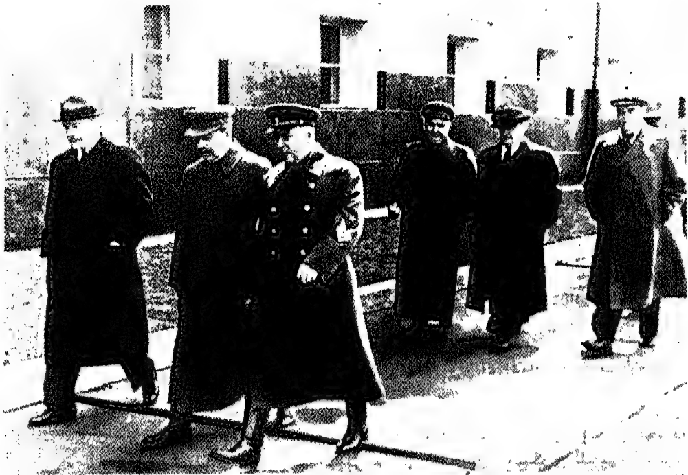
أثناء الحرب: ستالين محاطاً بالمارشال فوروشيلوف عن يساره ومولوتوف وزير الخارجية عن يمينه.